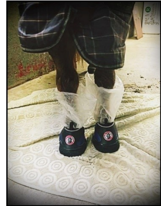
Det kan se ut såhär!

Maila oss på info@viahov.se och anmäl att du vill returnera. Då skickar vi returfraktsedel till dig (kostar 69kr). Vill du byta vara så lägger du bara en ny beställning så skickar vi ut detta som en vanlig order.